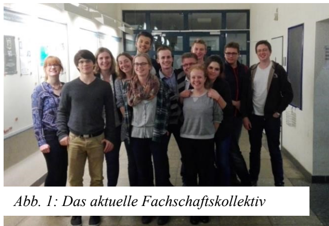
Abb. 1: Das aktuelle Fachschaftskollektiv